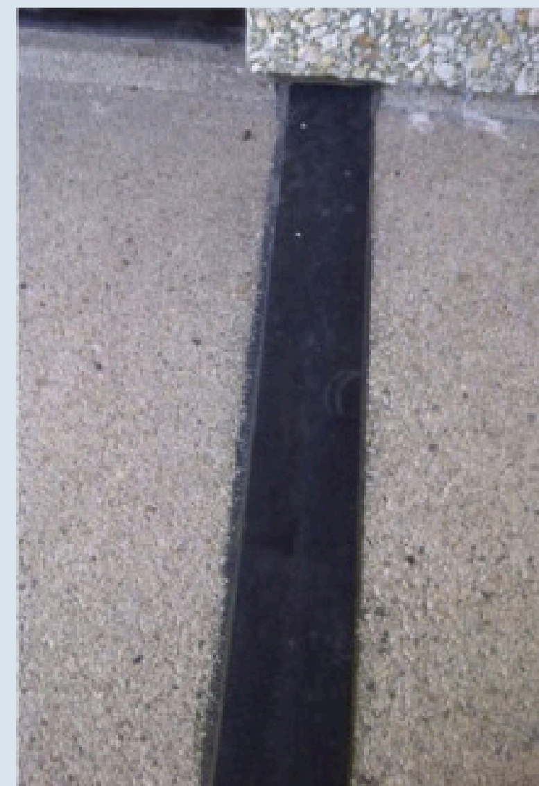
VOEGAFDICHTING IN EPDM ALS OPLOSSING?